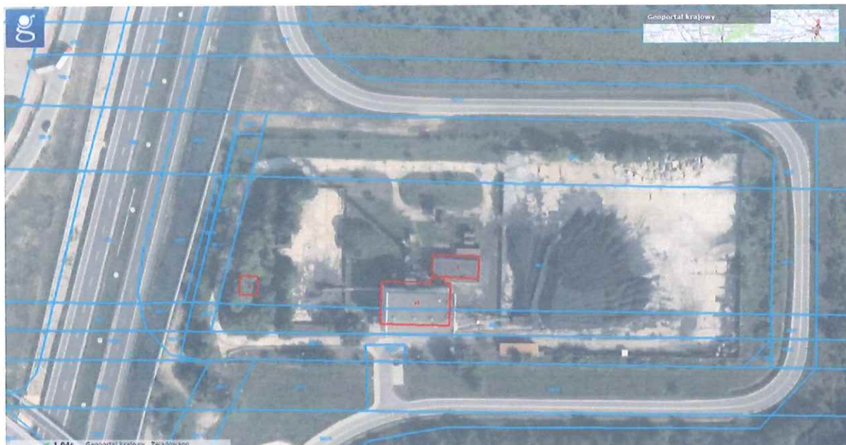
Rysunek 1 Widok działki 1381/1 w Szydłowcu, na której zostanie przeprowadzona inwestycja 1