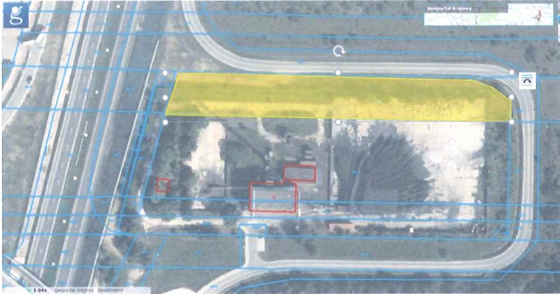
Rysunek 1 Widok działki 1380/11w Szydłowcu, na której zostanie przeprowadzona inwestycja 1

Na dzień ogłoszenia niniejszego postępowania na wydzielonym fragmencie działki trwa realizacja zadania inwestycyjnego "Modernizacja systemu ciepłowniczego Ciepłowni Miejskiej w Szydłowcu w celu zwiększenia jego efektywności – budowa instalacji kogeneracyjnej zasilanej gazem" dofinansowanego z Programu Operacyjnego Infrastruktura i Środowisko 2014-2020 1.6. promowanie wykorzystywania wysokosprawnej kogeneracji ciepła i energii elektrycznej w oparciu o zapotrzebowanie na ciepło użytkowe. Podziałane 1.6.1 Źródła wysokosprawnej kogeneracji.