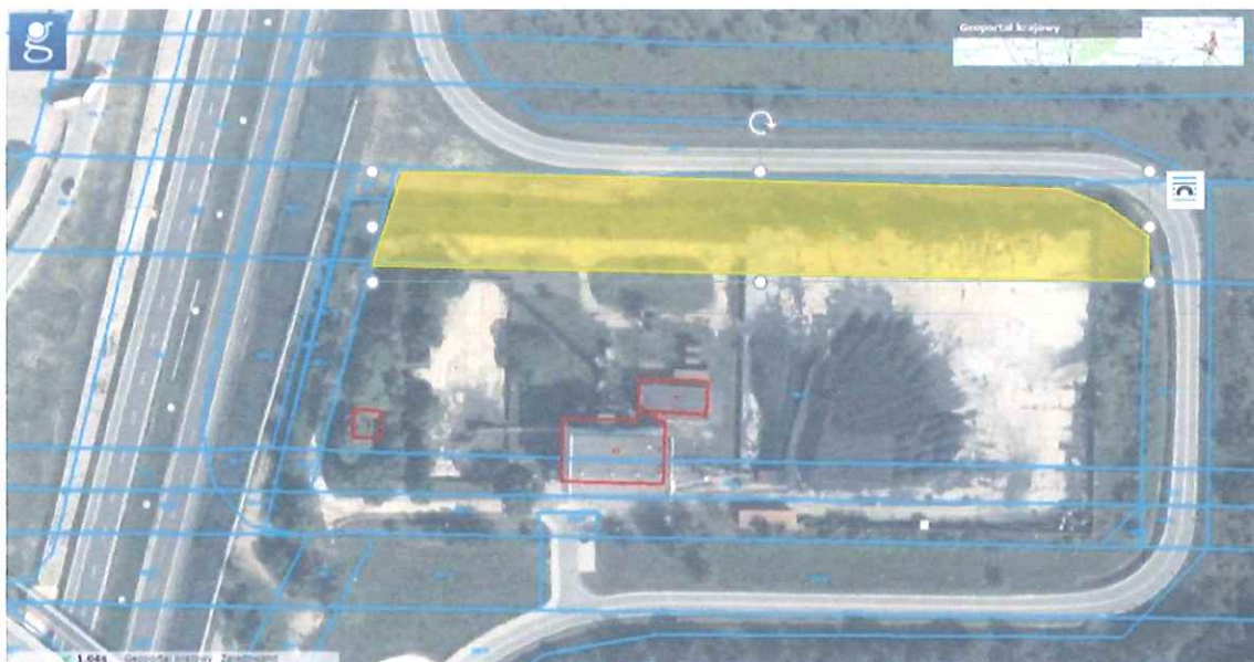
Rysunek 1 Widok działki 1380/11 w Szydłowcu, na której zostanie przeprowadzona inwestycja 1

Na dzień ogłoszenia niniejszego postępowania na wydzielonym fragmencie działki trwa realizacja zadania inwestycyjnego "Modernizacja systemu ciepłowniczego Ciepłowni Miejskiej w Szydłowcu w celu zwiększenia jego efektywności – budowa instalacji kogeneracyjnej zasilanej gazem" dofinansowanego z Programu Operacyjnego Infrastruktura i Środowisko 2014-2020 1.6. promowanie wykorzystywania wysokosprawnej kogeneracji ciepła i energii elektrycznej w oparciu o zapotrzebowanie na ciepło użytkowe. Podziałane 1.6.1 Źródła wysokosprawnej kogeneracji.